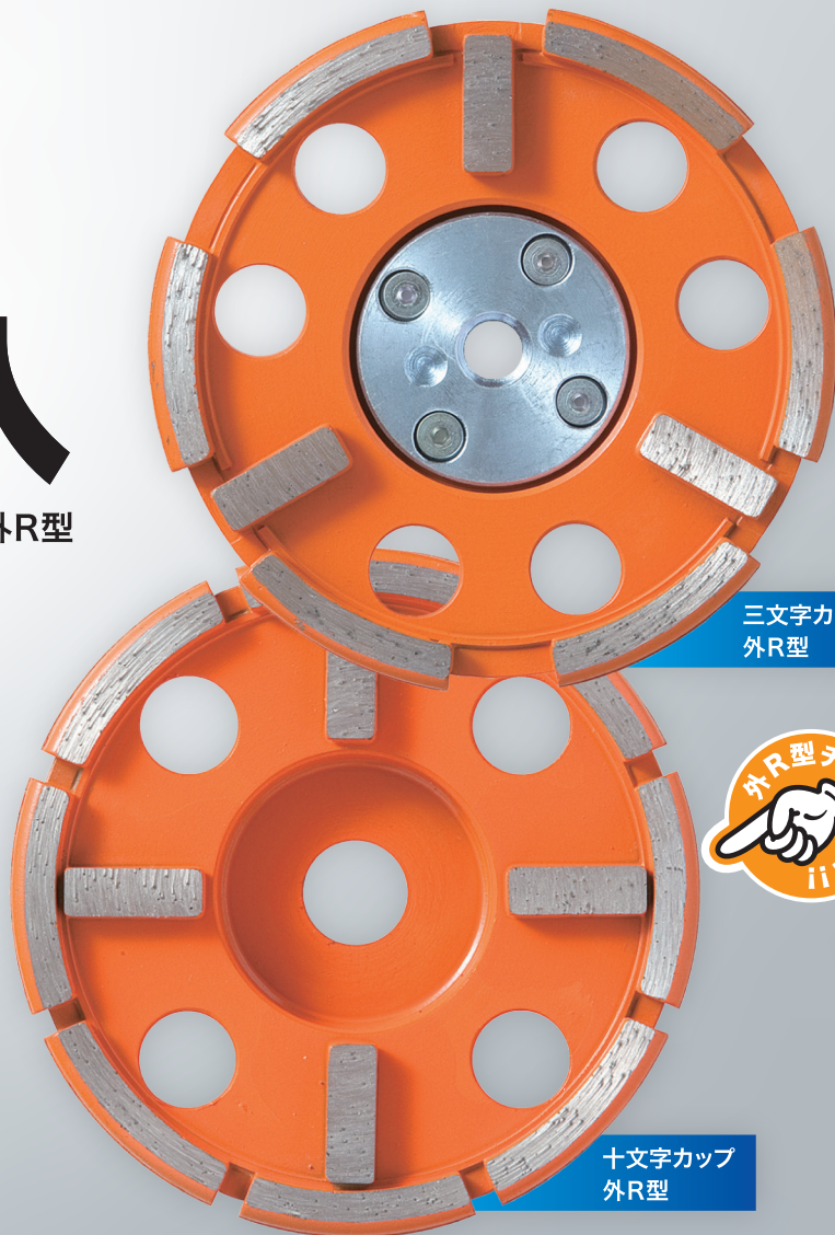
三文字カップ 外R型