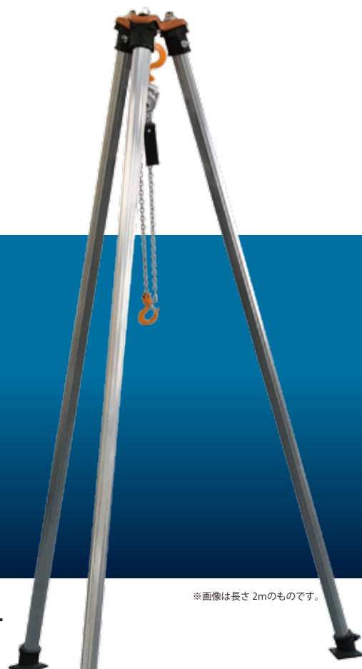
※画像は長さ2mのものです。