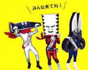
みんな来てね! ふるさと三木応援大使 「金物戦隊 かなもんジャー」

[主催]三木金物商工協同組合連合会 [共催]三木市・三木商工会議所・兵庫県北播磨県民局 [後援]神戸新聞社・ラジオ関西・株式会社日本刃物工具新聞社・エフエムみっきい・Kiss FM KOBE